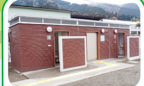
⑦ 愛川太陽光発電所のトイレ