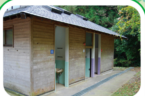
⑥ 八管山いこいの森トイレ