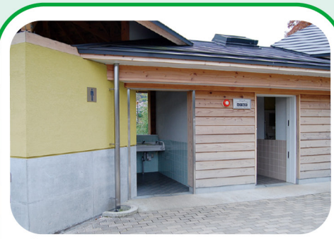
② 県立あいかわ公園南駐車場のトイレ