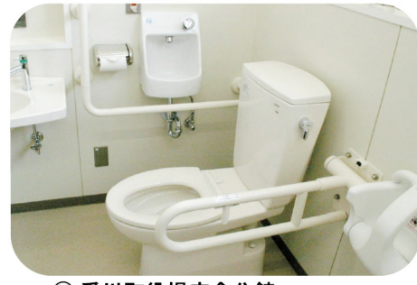
⑭ 愛川町役場庁舎分館