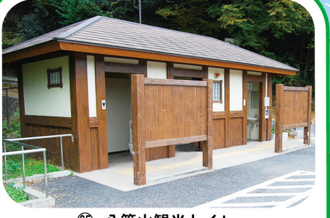
⑨ 八管山観光トイレ